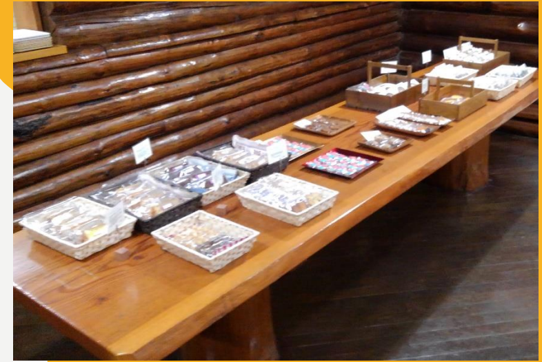
木のテーブルにはお菓子がいっぱい