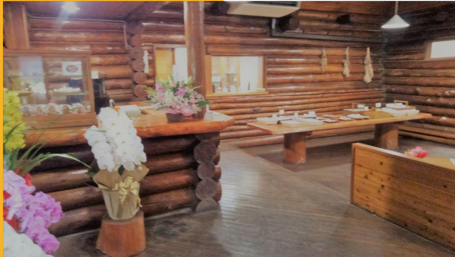
木がふんだんに使われた室内