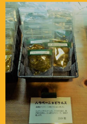
これはハマりました