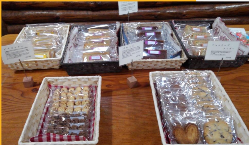
自然素材のお菓子はとっても美味