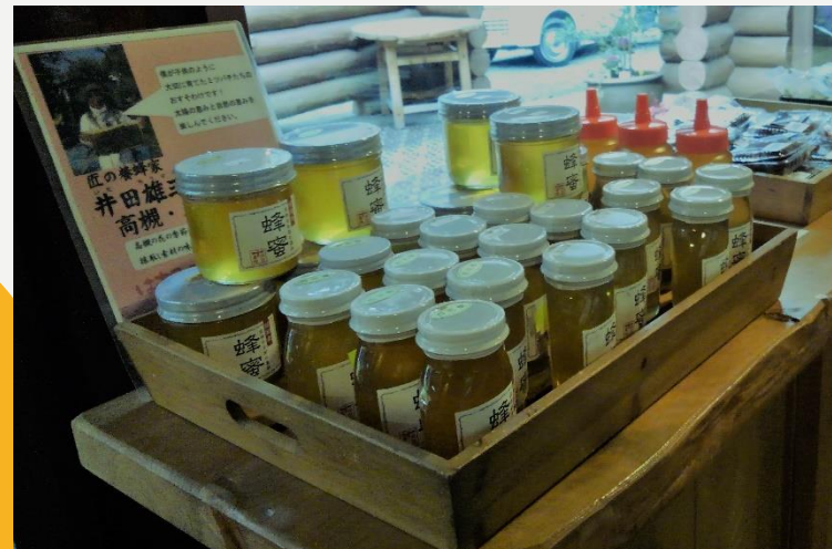
高槻産のはちみつも人気アイテム