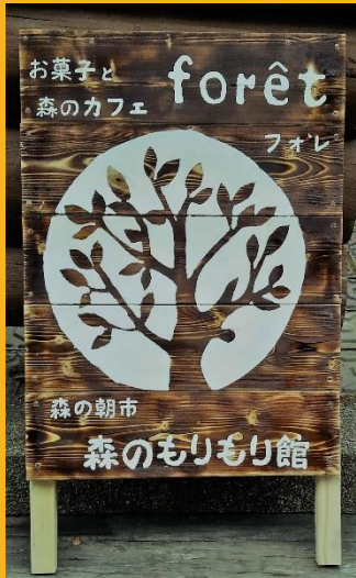
焼スギの看板がお出迎え

1月5日に新たにオープンしました。ログの建物の風合いを活かし、地元の食材などを使ったお菓子とこだわりのドリンクをご提供しております。